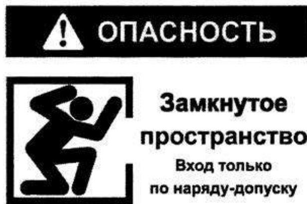
Рекомендуемый знак "ОЗП"